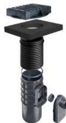
ŠAHT ZA KIŠNICU

Uz pomoć Stormbox-a, moći ćete da skladištite količine kišnice prikupljene iz urbanih područja i pustite ih da se odvede brzinom kojom su imali pre izgradnje iste oblasti.