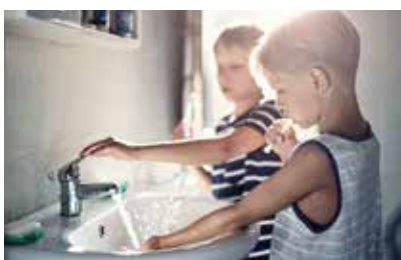
SANITARNA PIJAĆA VODA

Sigurna, higijenska i bezbedna distribucija sanitarne vode je osnova našeg načina života. Sirovine koje koristimo su proverenog kvaliteta, a tehnologija je razvijena do savršenstva. Radopress sistem obuhvata širok spektar cevi i fittinga. Karakteriše ga visok stepen otpornosti na habanje, otpornost na koroziju, nizak nivo buke i neprovodljivost struje.