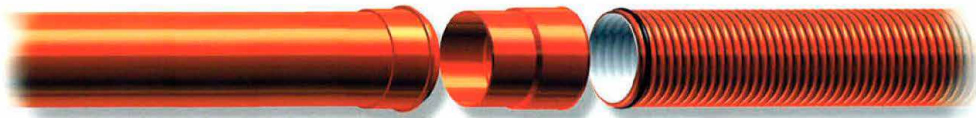
ГЛАДКОСТЕННА PVC ТРЪБА