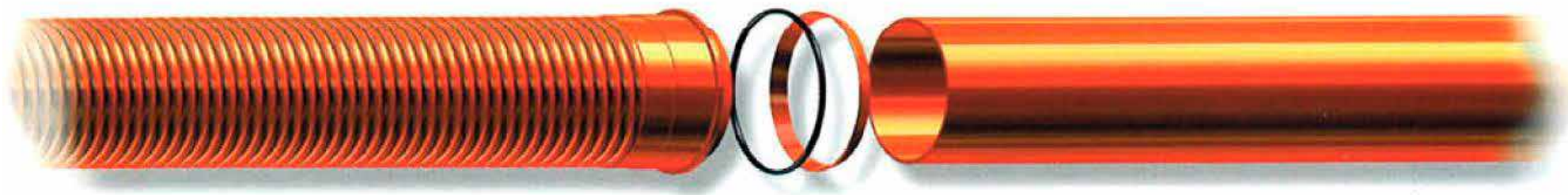
ТРЪБА PP-B PRAGMA®